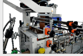
SLOT NOZUL İLE POLİÜRETAN HOTMELT (PUR) TUTKAL UYGULAMA SİSTEMİ POLYURETHANE HOTMELT (PUR) GLUE APPLICATION SYSTEM WITH SLOT NOZZLE ДЮЗА НАНЕСЕНИЯ ПУР КЛЕЯ (ТЕРМОПЛАВКИЙ ПОЛИУРЕТАН)