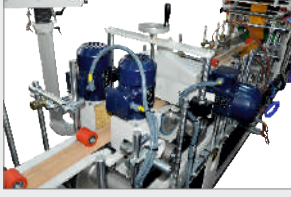
ÖN, ARKA VE ÜST FIRÇA SİSTEMİ FRONT, REAR AND TOP BRUSH SYSTEM ВЕРХНЯЯ И БОКОВЫЕ ЩЕТКИ