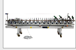
3 / 4 / 5 METRE EKSTRA KASET SİSTEMİ 3 / 4 / 5 METER EXTRA CASSETTE (WRAPPING) UNIT 3 / 4 / 5 м ДОПОЛНИТЕЛЬНЫЕ КАСЕТТЫ ОКУТЫВАНИЯ