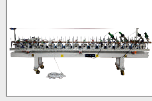
3 / 4 / 5 METRE EKSTRA KASET SİSTEMİ

3 / 4 / 5 METER EXTRA CASSETTE (WRAPPING) UNIT