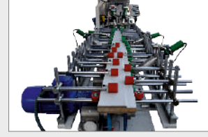
SARMA MODÜLÜ WRAPPING ZONE ЗОНА ОКУТЫВАНИЯ

ДЮЗА НАНЕСЕНИЯ ПУР КЛЕЯ (ТЕРМОПЛАВКИЙ ПОЛИУРЕТАН)