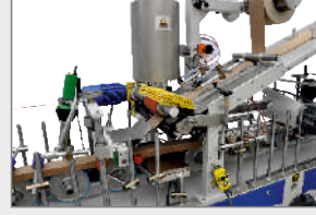
TUTKAL SÜRME MERDANELİ EVA / PO HOTMELT UYGULAMA İSTASYONU EVA / PO HOTMELT APPLICATION STATION WITH ROLLER COATER UZEL ROLIKOVOGO NANESENİYA THERMOPLAVKOGO KLEYA EVA / PO