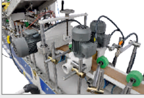
ÖN, ARKA VE ÜST FIRÇA SİSTEMİ FRONT, REAR AND TOP BRUSH SYSTEM