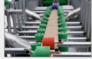
SARMA MODÜLÜ WRAPPING ZONE ЗОНА ОКУТЫВАНИЯ