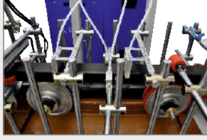
PRİMER UYGULAMA İSTASYONU PRIMER APPLICATION SYSTEM УЗЕЛ НАНЕСЕНИЯ ПРАЙМЕРА